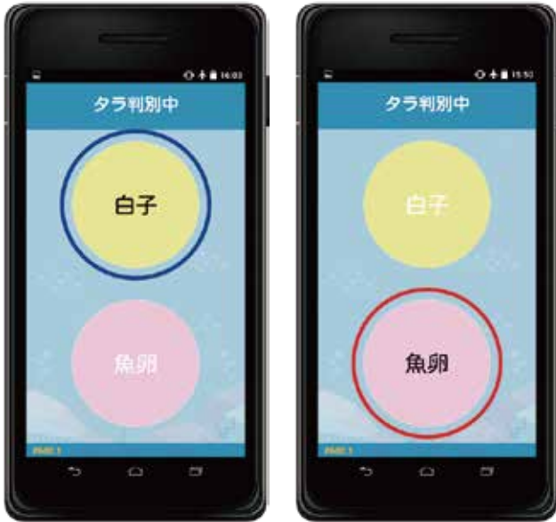
白子・魚卵の判別結果画面